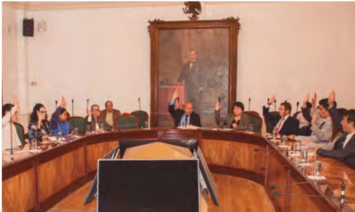
Buscan garantizar una vida libre de violencia y con respeto a sus derechos.

Instalan el Sistema Municipal de Protección Integral de Niñas, Niños y Adolescentes, a cargo del DIF municipal