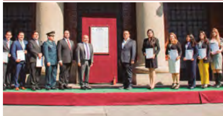
Colocan el Bando en la entrada del Palacio Municipal.