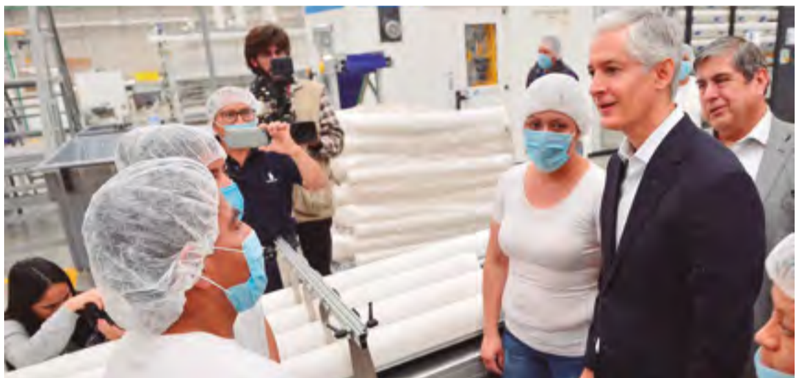
Pág. 14 El mandatario indicó que esta es una oportunidad de desarrollo para la región.

de compromiso con la innovación, el desarrollo sustentable y la protección medioambiental, ya que se ha posicionado como una compañía líder en la industria del papel. "Gracias a los empresarios que confían en nosotros y queremos que el Estado de México siga siendo una fuente de confianza, de estabilidad, de certeza jurídica y de oportunidades de desarrollo para las familias y para las empresas que se instalen en nuestro estado", enfatizó.