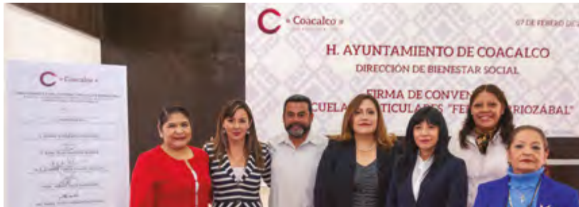
A través del programa de Becas "Felipe Berriozábal", los beneficiados obtendrán recursos hasta del 50 por ciento en el pago de colegiaturas.

Más de 500 estudiantes podrán continuar sus estudios en nivel medio superior y superior en escuelas privadas