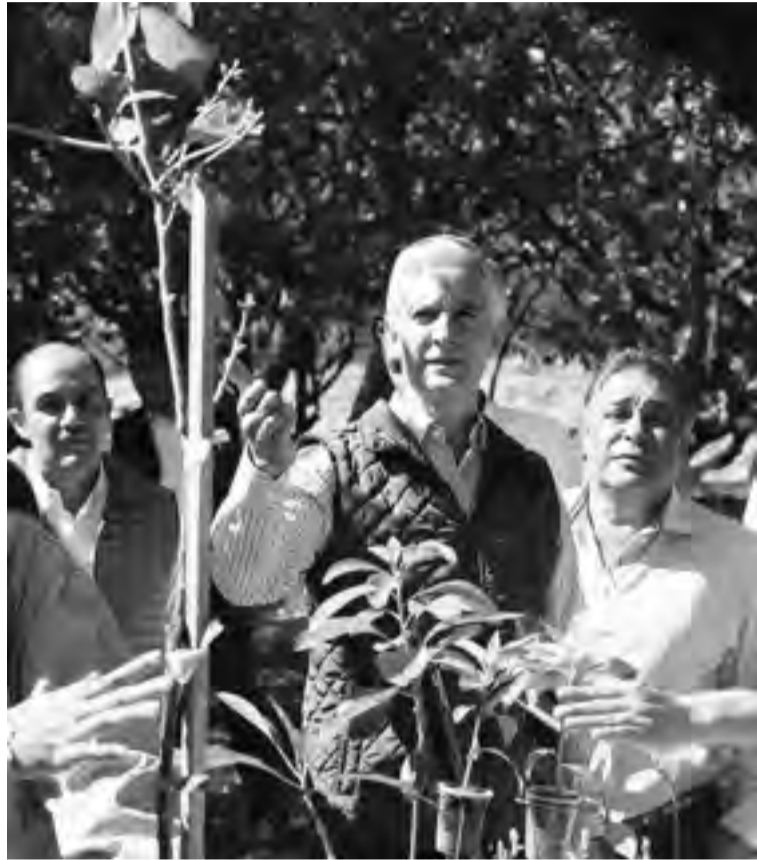
A nivel nacional, la entidad ocupa el tercer lugar en la producción del llamado oro verde.

El gobernador Alfredo del Mazo indicó que también se trabaja para generar más toneladas de este fruto