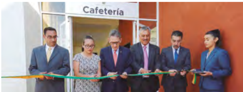
Inaugura cafetería de la Preparatoria "Isidro Fabela Alfaro".

El rector de la UAEM afirmó que es una garantía para que evolucione el pensamiento