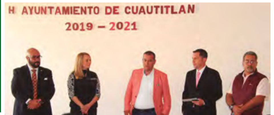
Capacitan a consejeros de empleo de este y otros municipios.

Asimismo, recordó que Cuautitlán cuenta con una Oficina Municipal de Empleo, donde también se están impulsando medidas para ampliar las oportunidades de trabajo. Las personas interesadas en busca de una vacante laboral, pueden acudir a la Oficina Municipal de Empleo de Cuautitlán, en la calle Tranquilino Salgado, colonia Centro, de lunes a viernes de las 9:00 a 17:00 horas.