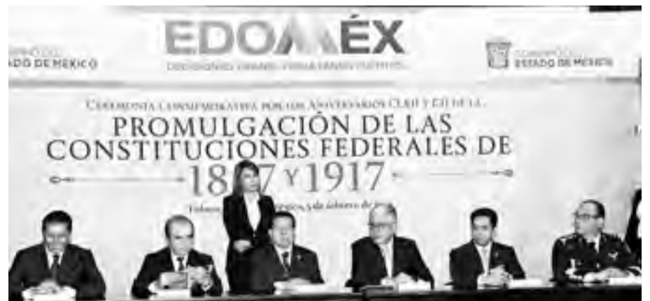
El gobierno estatal trabaja para brindar bienestar a las familias mexiquenses.

Este desafío, dijo, requiere de la participación de los Poderes Ejecutivo, Legislativo y Judicial, a nivel federal y estatal, así como de todos los municipios y las organizaciones de la sociedad civil y sus diferentes sectores.