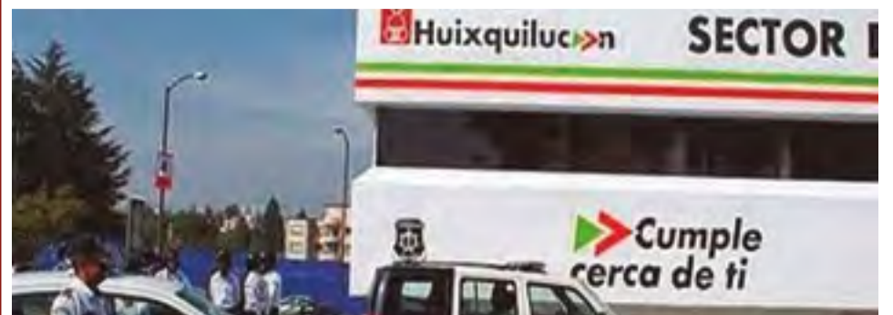
El alcalde Enrique Vargas indicó que es una medida preventiva para no fallar en las tareas contra la delincuencia.

El titular del Sistema Aguas explicó que el pozo inaugurado tendrá una afluencia de 16 litros por segundo, a través de un tubo de 350 metros de profundidad, utilizando un variador de velocidad de 150 caballos de fuerza y con un voltaje de 440 voltios.