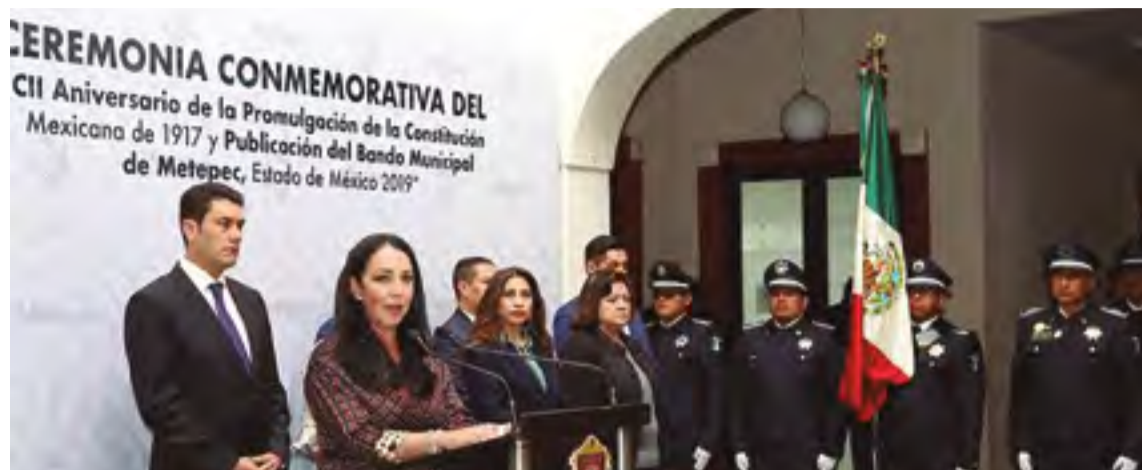
En Metepec se conmemoró el CII Aniversario de la Constitución Política Mexicana.