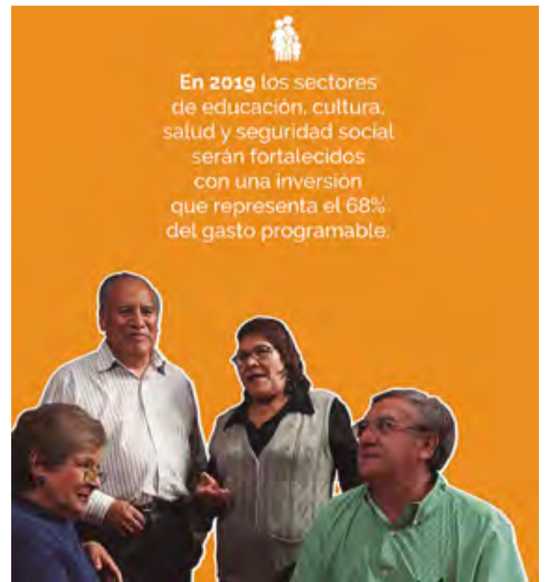
Se pretende beneficiar a los sectores sociales para que beneficien a la sociedad.

rán estos recursos son el Instituto de Salud del Estado de México (ISEM), que recibirá un presupuesto anual de 26 mil 134 millones 379 mil 320 pesos; la Secretaría de Salud, 132 millones 617 mil 475 pesos; la Secretaría de Educación, 45 mil 875 millones 728 mil 322 pesos, y la de Desarrollo Social, 7 mil 368 millones 10 mil 126 pesos. El documento, que puede consultarse íntegramente en el sitio de Legistel, expone en el anexo III que el tema social es el primero de los cuatro pilares o ejes del Plan de Desarrollo estatal; los otros son el económico, el territorial y el de seguridad.