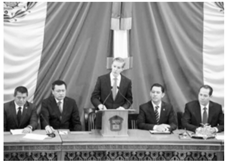
El gobernador Alfredo Del Mazo en su toma de protesta se comprometió a cumplir y hacer cumplir la ley en el Estado de México y si no que el pueblo se lo demand.

Sólo faltan un par de semanas para que se lleguen a los dos años de este sexenio 2017-2023 que preside Del Mazo Maza y desde el Congreso Local se está alzando la voz para que se cumpla aquel exhorto que firmaron el 25 de abril de 2017 en uno de los debates los aspirantes a la gubernatura; referente a que de no cumplir las expectativas en lo gubernamental y en lo social se someterían al escrutinio de la gente y aceptar su separación del cargo; lo que veremos si cumple.