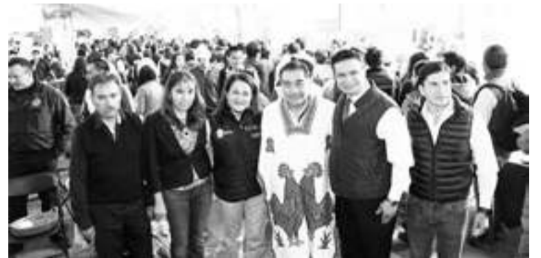
Almoleya de Juárez / Edo. de Méx.

Acciones alineadas a la Agenda 2030 de la ONU