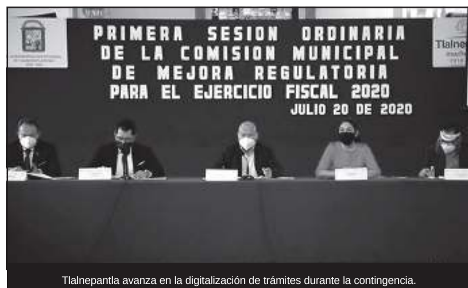
Tlalnepantla avanza en la digitalización de trámites durante la contingencia.