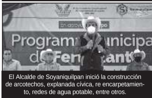
El Alcalde de Soyaniquilpan inició la construcción de arcotechos, explanada cívica, re encarpentamiento, redes de agua potable, entre otros.