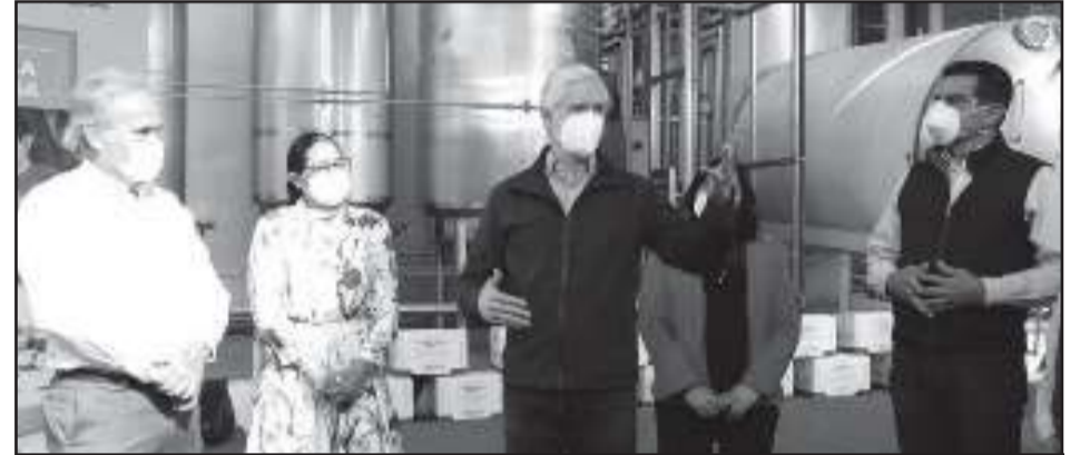
El Gobernador Alfredo Del Mazo visitó la fábrica de lácteos la Covadonga ubicada en el municipio de Texcoco.

El Gobernador subrayó la importancia de no bajar la guardia en este momento de reapertura de negocios, ya que el COVID-19 continúa representando un riesgo para la población, y consideró que cuidar de sí mismo, así como de los demás, es una responsabilidad de todos y una muestra de solidaridad.