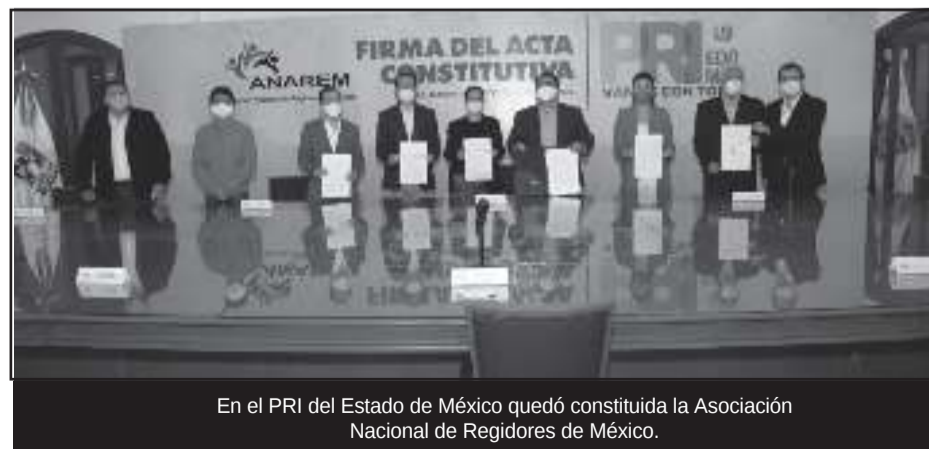
En el PRI del Estado de México quedó constituida la Asociación Nacional de Regidores de México.