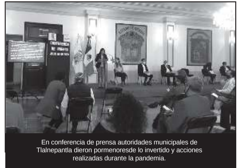
En conferencia de prensa autoridades municipales de Tlalnepantla dieron pormenores de lo invertido y acciones realizadas durante la pandemia.

Mayor, informó que el Gobierno de Tlalnepantla ha destinado 61 millones de pesos para apoyar a los ciudadanos y mitigar los riesgos de la pandemia entre la población y trabajadores de la administración municipal, como apoyos de alimentos, insumos y un contrato de servicios funerarios en apoyo a las familias de las personas fallecidas.