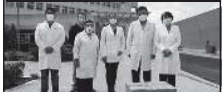
Un total de mil 400 mascarillas fueron distribuidas entre el personal de los hospitales Centro Médico "Adolfo López Mateos" y "Dr. Nicolás San Juan".