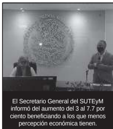
El Secretario General del SUTEyM informó del aumento del 3 al 7.7 por ciento beneficiando a los que menos percepción económica tienen.