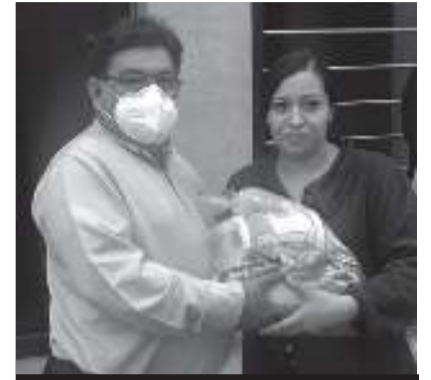
El Diputado Francisco Solorza informó que han aportado un mes de salario personal para la compra de productos de la canasta básica.

Durante estas entregas el diputado Solorza explica a los beneficiarios "Este es un apoyo excepcional para las familias de Atizapán, en un tiempo excepcional por la pandemia de Coronavirus".