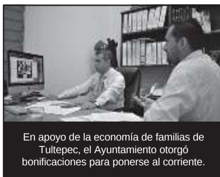
En apoyo de la economía de familias de Tultepec, el Ayuntamiento otorgó bonificaciones para ponerse al corriente.

La bonificación en estos casos también será en virtud de la situación económica del contribuyente, exceptuando aquellos inmuebles que tengan en su totalidad un uso meramente comercial. Para mayores informes respecto a los descuentos y subsidios, los interesados deben acudir a la Tesorería municipal.