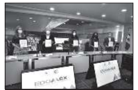
Los titulares de las Secretarías, de Seguridad, Desarrollo Social y del Trabajo, signaron un convenio de colaboración para impulsar el pleno progreso de mujeres en reclusión.

La Secretaría de Seguridad le recuerda que los teléfonos 089 Denuncia Anónima y 9-1-1 Número de Emergencias trabajan las 24 horas del día. Puede contactarnos a través de las redes sociales: Facebook @SS.edomex, y en Twitter @SS_Edomex.