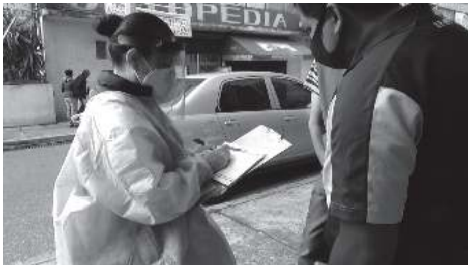
Al regreso de las actividades el OPERAGUA realiza los protocolos de prevención y protección de los empleados.

Se invita, de manera responsable, al personal que labora en las diferentes áreas de gobierno, así como a los usuarios que por alguna razón deban acudir a ellas, si detectan algún síntoma como fiebre, tos seca, cansancio, dolor de garganta, dolor en el pecho, entre otros, no acudir a su lugar de trabajo y eliminar cualquier sospecha de COVID-19.