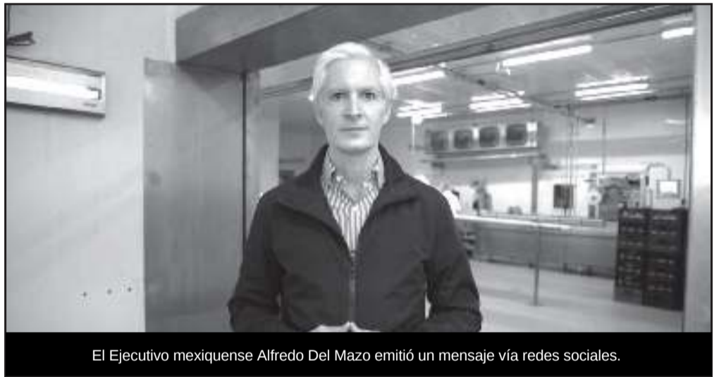
El Ejecutivo mexiquense Alfredo Del Mazo emitió un mensaje vía redes sociales.