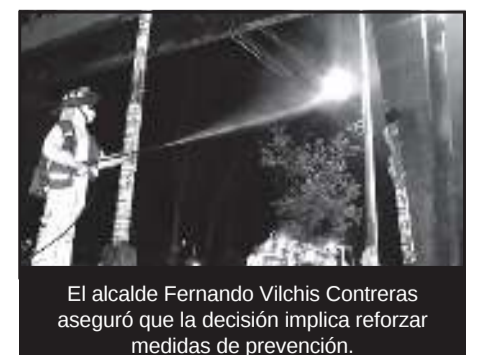
El alcalde Fernando Vilchis Contreras aseguró que la decisión implica reforzar medidas de prevención.

Asimismo, continúan los operativos para impedir reuniones y eventos sociales, logrando desactivar hasta la fecha 90 reuniones, en breve se iniciará la distribución de más de 300 mil kits de salud en los hogares para reforzar las medidas de prevención entre los habitantes.