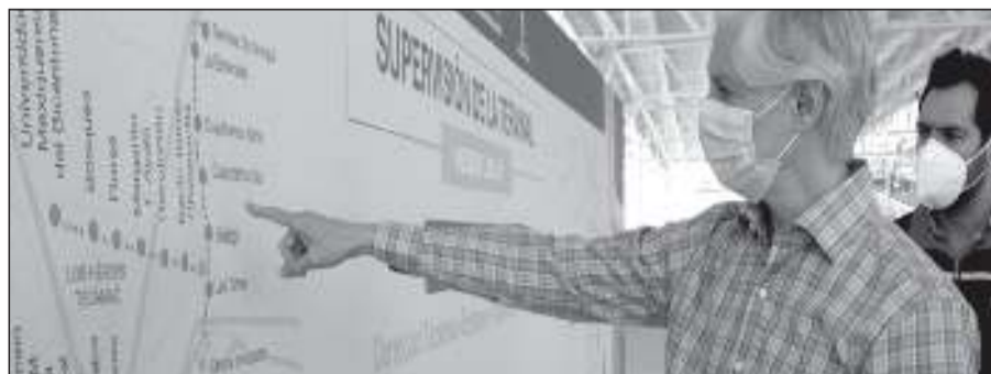
La Línea IV del Mexibús lleva un avance del 95 por ciento así lo informó el gobernador Alfredo Del Mazo.

Durante la pandemia por COVID-19, el Gobierno del Estado de México reforzó las medidas de higiene en los sistemas articulados de transporte, como lo son el Mexibús y Mexicable, para cuidar de la salud de los pasajeros.