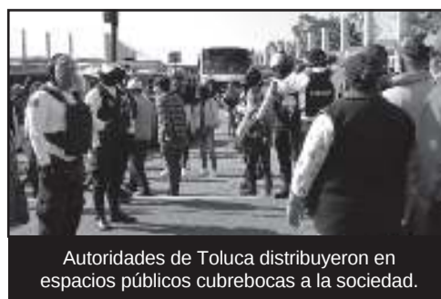
Autoridades de Toluca distribuyeron en espacios públicos cubrebocas a la sociedad.

La administración municipal, que preside el alcalde Juan Rodolfo Sánchez Gómez, exhorta a la ciudadanía a no hacer caso omiso de las recomendaciones de las autoridades sanitarias sobre las medidas de contención de COVID-19, como el uso de material de protección y quedarse en casa.