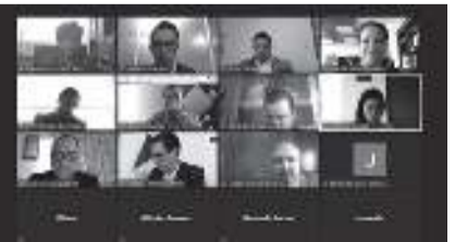
El Estado de México es el primero en designar a su Director General del Centro de Conciliación Laboral.

Finalmente, el Presidente del Tribunal Superior de Justicia en el Estado de México, Ricardo Sodi Cuéllar, sostuvo que el objetivo es llegar a una justicia laboral restaurativa y la conciliación debe ser la apuesta de todos.