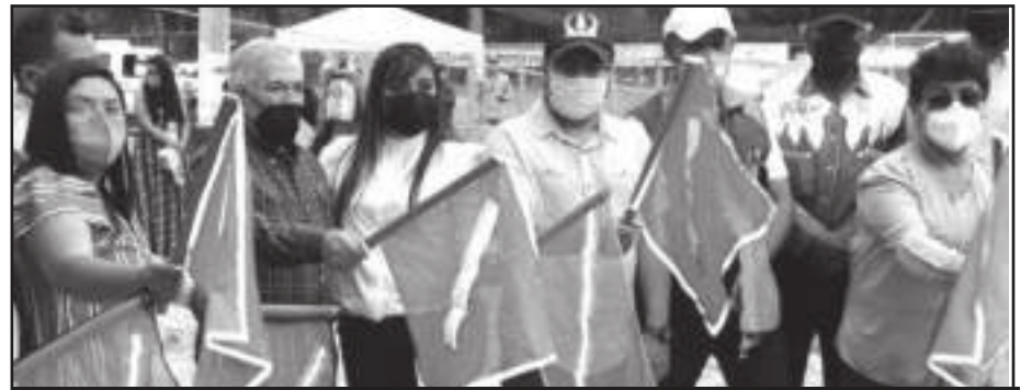
Inician y entregan obras de beneficio social autoridades de la administración 2019-2021 en Tepetzotlán.

Tepetzotlán, quien refrendándole su apoyo le ha permitido en varias ocasiones dirigir el destino de este pueblo mágico, "confiando en la buena administración de los recursos que pagan puntualmente sus impuestos con los que se realizan este tipo de obras", acotó.