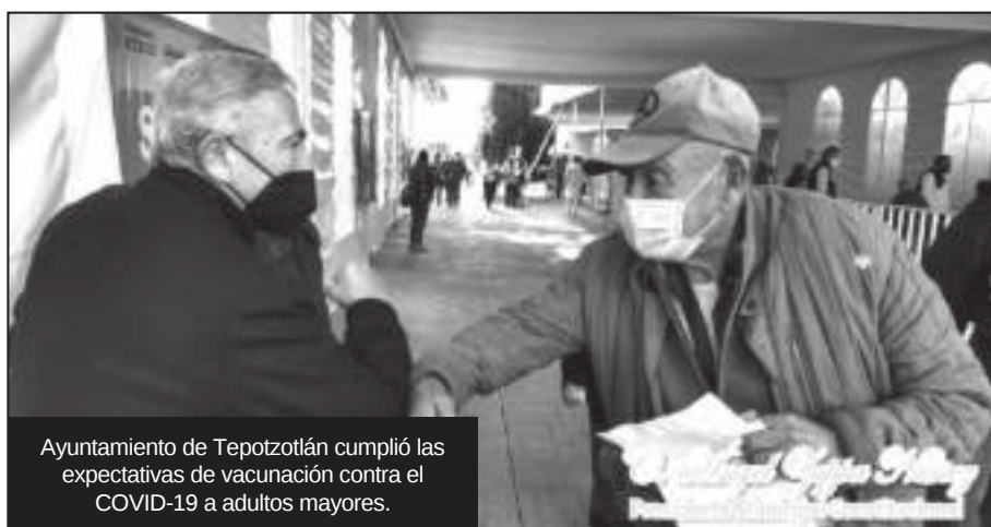
Ayuntamiento de Tepetzotlán cumplió las expectativas de vacunación contra el COVID-19 a adultos mayores.

En tanto, el personal de salud a cargo de la vacunación externó su agradecimiento al Presidente Municipal y a su equipo de trabajo, por el excelente trato que les dieron y la gran colaboración que mostraron durante los días de vacunación. Aseguraron que habían estado en otros municipios: "Tepetzotlán resultó ser un ejemplo a nivel Estado de México".