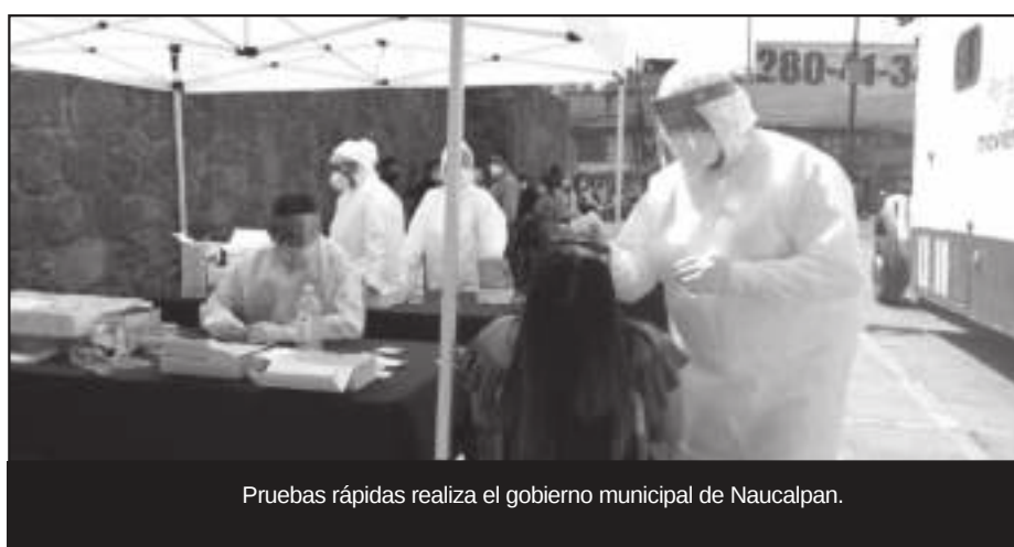
Pruebas rápidas realiza el gobierno municipal de Naucalpan.

Por todo lo anterior, el Gobierno municipal pide a la ciudadanía no bajar la guardia, pues seguimos en Semáforo Epidemiológico Naranja, por lo que es necesario el uso de cubrebocas, el cual debe abarcar nariz, boca y barbilla, mantener la sana distancia y el lavado frecuente de manos.