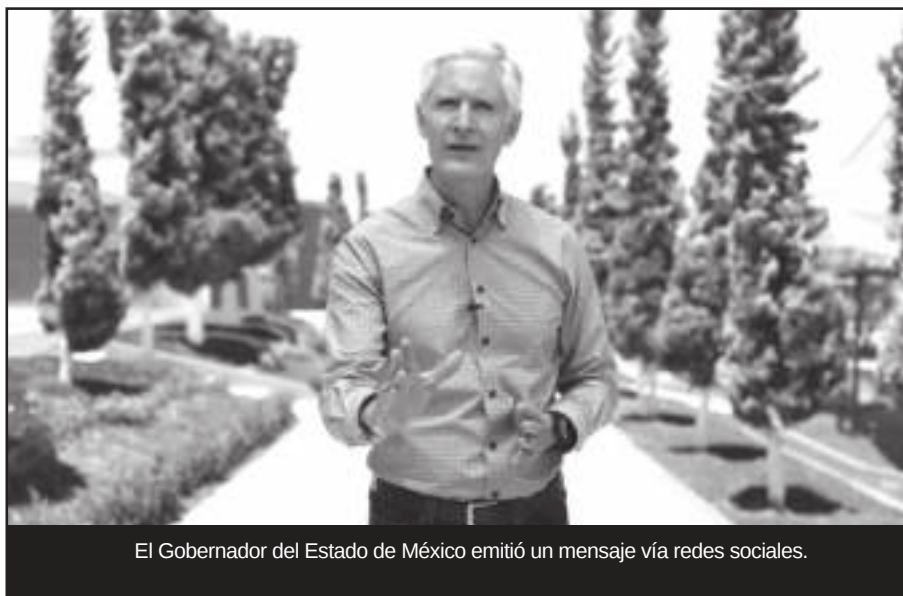
El Gobernador del Estado de México emitió un mensaje vía redes sociales.