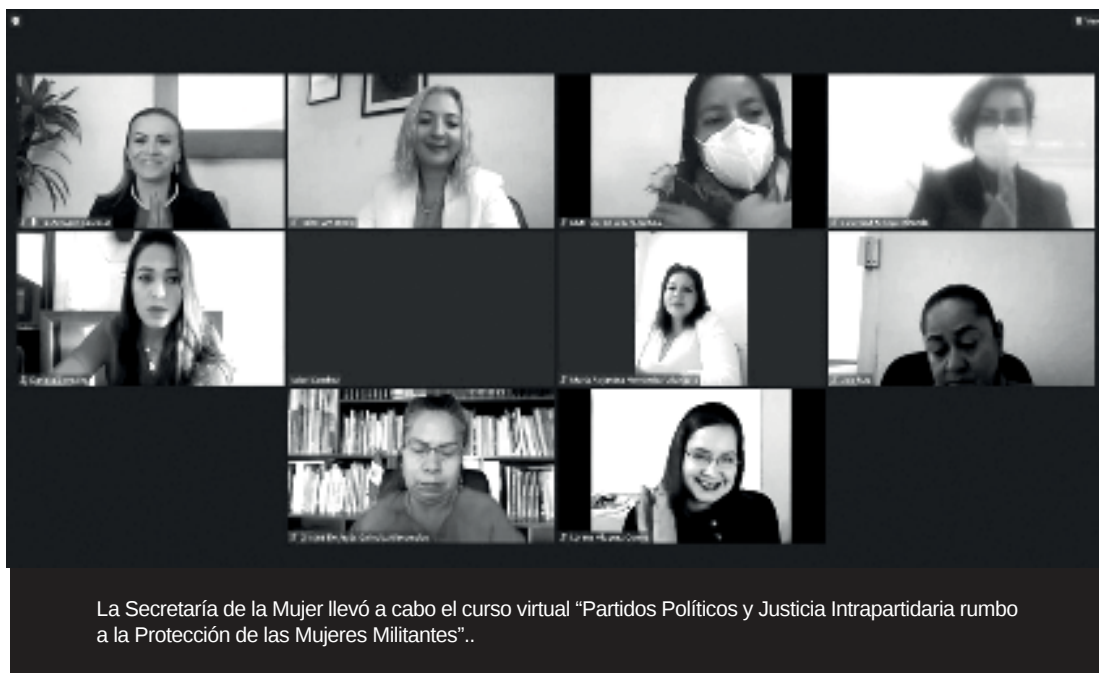
La Secretaría de la Mujer llevó a cabo el curso virtual “Partidos Políticos y Justicia Intrapartidaria rumbo a la Protección de las Mujeres Militantes”..

En la plática, la titular de la Unidad Administrativa de Igualdad de Género y Erradicación de la Violencia del Tribunal Electoral del Estado de México (TEEM), comentó que es fundamental que sean vigilantes, ya que este tipo de violencia pudiera poner en riesgo el principio de paridad y los derechos político electorales de las mujeres.