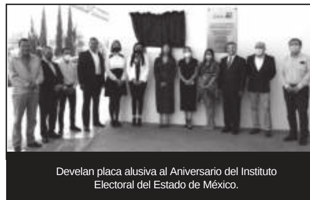
Develan placa alusiva al Aniversario del Instituto Electoral del Estado de México.

Entre las áreas que cuentan con dicho personal laborando destacan: Presidencia, la Secretaría Ejecutiva, la Dirección de Administración, la Dirección Jurídico-Consultiva, la Dirección de Organización, la Dirección de Participación Ciudadana, la Dirección de Partidos Políticos, la Unidad Técnica para la Administración del Personal Electoral, la Unidad de Comunicación Social, la Unidad de Informática y Estadística, la Unidad Técnica de Fiscalización, Contraloría General, así como el Centro de Formación y Documentación Electoral.