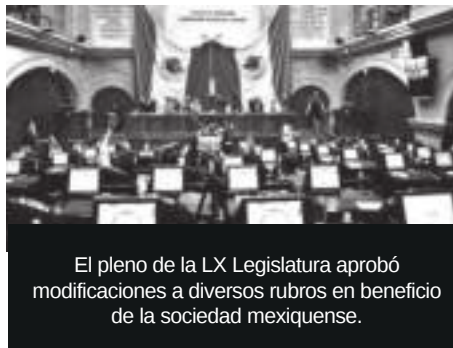
El pleno de la LX Legislatura aprobó modificaciones a diversos rubros en beneficio de la sociedad mexiquense.

Durante la asamblea se otorgó licencia definitiva y temporal a dos legisladoras y tomó protesta a Maximino Reyes Rivera para fungir como diputado del 1 de abril al 14 de junio, además de avalar modificaciones en la integración de diversas comisiones legislativas. Y se desahogaron puntos de acuerdo y exhortos en materia de tratamiento de aguas residuales e incendios forestales.