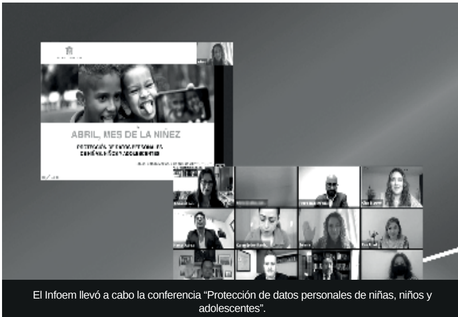
El Infoem llevó a cabo la conferencia "Protección de datos personales de niñas, niños y adolescentes".

Es preciso acotar que la conferencia estuvo a cargo de personal del Infoem, en donde niñas, niños, adolescentes y personal del servicio público presentes, conocieron acerca de la protección de datos personales, seguridad digital, los riesgos de compartir nuestros datos en Internet, así como la prevención y medidas de seguridad contra la vulneración de datos. "La privacidad y la protección de datos es un derecho humano", concluyeron los expositores.