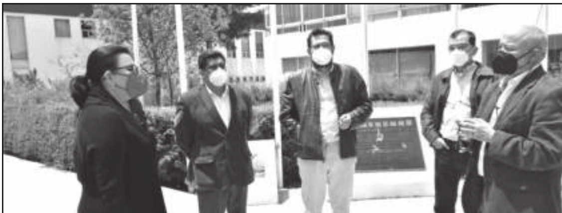
Se revisarán las condiciones laborales, estímulos académicos, insumo, materiales, equipo e infraestructura dijo la aspirante a rectora.

las y los investigadores se ofrezcan condiciones para desarrollar procesos de enseñanza-aprendizaje y de investigación, pero para lograrlo, se debe realizar un diagnóstico que esté basado en el trabajo de especialistas de la propia universidad, pero, sobre todo, en los puntos de vista de quienes viven el día a día de la investigación". Resaltó además que "no es aceptable que haya profesores que pertenecen al Sistema Nacional de Investigadores que no tienen plazas de Tiempo Completo y mucho menos definitiva, por lo que es fundamental que haya una revisión que permita acceder prioritariamente a dichos beneficios a quienes tienen los méritos suficientes".