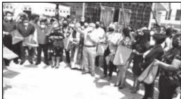
Líderes sociales, empresarios, ejidatarios, autoridades auxiliares, transportistas y vecinos atestiguaron el inicio de los trabajos sobre la autopista.

"Sabemos que hace falta aún por hacer, pero debemos estar conscientes de los grandes logros que juntos hemos realizado y de la importancia que todos jugamos en este papel de nuestra sociedad", repuso e invitó a la población a no bajar la guardia; a seguir trabajando, gobierno y ciudadanos de la mano "con esa sinergia que nos ha caracterizado, porque juntos lo hemos logrado, sigamos con ánimos renovados y con fe en seguir haciendo que las cosas sucedan y que estemos en constante movimiento".