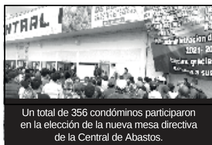
Un total de 356 condóminos participaron en la elección de la nueva mesa directiva de la Central de Abastos.