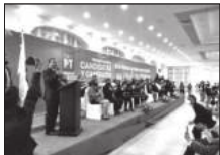
Dirigentes estatales del PT presentaron a los candidatos a Diputados Federales que competirán en el próximo proceso electoral.

El Partido del Trabajo (PT) presentó y tomó protesta a las y los candidatos a Diputados Federales, marco en el cual los distintos dirigentes del proyecto maoísta "línea de masas" destacaron ser una auténtica fuerza de izquierda que contribuye a la consolidación de la 4T que encabeza Andrés Manuel López Obrador.