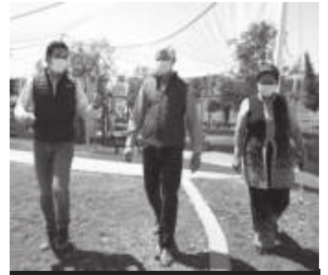
Autoridades estatales comentaron que este parque permite preservar el medio ambiente al conservar áreas verdes que limpian el aire.

Este espacio está cerca también de las comunidades de San Felipe Teotitlán, Tiamapa y de la cabecera de Nopaltepec..