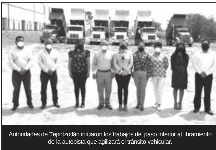
Autoridades de Tepotzotlán iniciaron los trabajos del paso inferior al libramiento de la autopista que agilizará el tránsito vehicular.