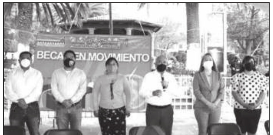
Autoridades de Tepetzotlán entregaron apoyos económicos del programa "Una Beca en Movimiento" a estudiantes del municipio.

Respecto a esta entrega de becas, el Presidente Municipal hizo énfasis en que este programa fue creado para apoyar a los estudiantes y por lo tanto es financiado con recursos 100 por ciento municipales, reafirmando su compromiso con la educación, respondiendo a la confianza de la gente y consciente de que no hay mejor inversión que la que se realiza por la educación.