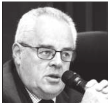
Jorge Insunza Armas presidente del Partido Acción Nacional en el Estado de México.

"Hoy hay 10 millones más de pobres, por el mal manejo de la pandemia, quebraron un millón de negocios y 2.9 millones de mexicanos quedaron desempleados. Es tiempo de comparar y el PAN Legisla y Gobierna Mejor", concluyó el panista.