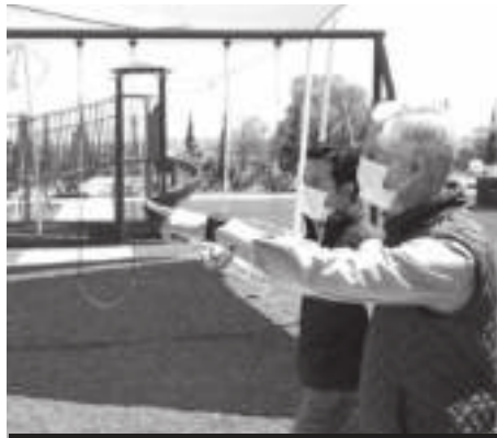
Supervisa el Ejecutivo del Estado de México los trabajos del Parque Ecológico de Nopaltepec.

“Estos espacios nos permiten impulsar y promover la convivencia familiar y también nos ayudan a acercar a los jóvenes al deporte, alejarlos de vicios, de actividades no productivas”, agregó.