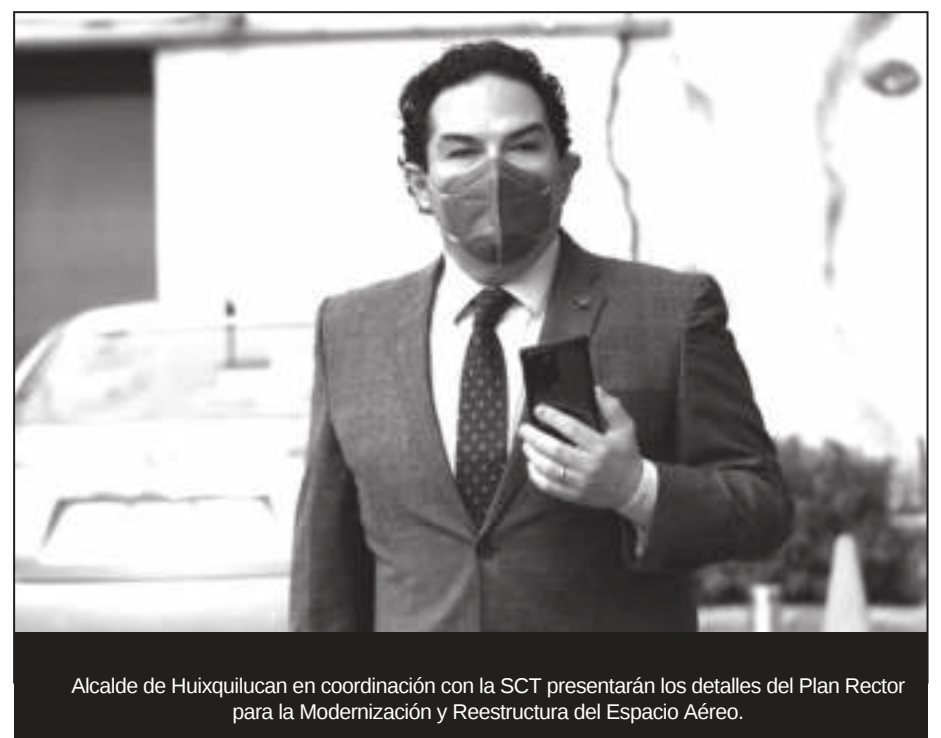
Alcalde de Huixquilucan en coordinación con la SCT presentarán los detalles del Plan Rector para la Modernización y Reestructura del Espacio Aéreo.

El gobierno municipal local reconoció la disposición de la Secretaría de Comunicaciones y Transportes para informar a los vecinos y autoridades locales sobre el rediseño que está realizando y confió en que a la brevedad, se puedan encontrar nuevas alternativas que den viabilidad al Sistema Aeroportuario Metropolitano, sin afectar el patrimonio de las familias y garantizando el derecho a una vida armoniosa para éstas zonas habitacionales.