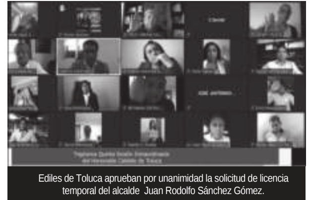
Ediles de Toluca aprueban por unanimidad la solicitud de licencia temporal del alcalde Juan Rodolfo Sánchez Gómez.

Asimismo, el Secretario del Ayuntamiento dio a conocer el número y contenido de los expedientes turnados a comisiones edilicias durante el mes de marzo de 2021, con mención de los resueltos y los pendientes de dictaminar, en cumplimiento de lo establecido en el artículo 91 fracción III de la Ley Orgánica Municipal del Estado de México.